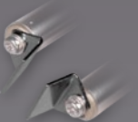
Art.-Nr.: 21435 16 MM SPITZEN